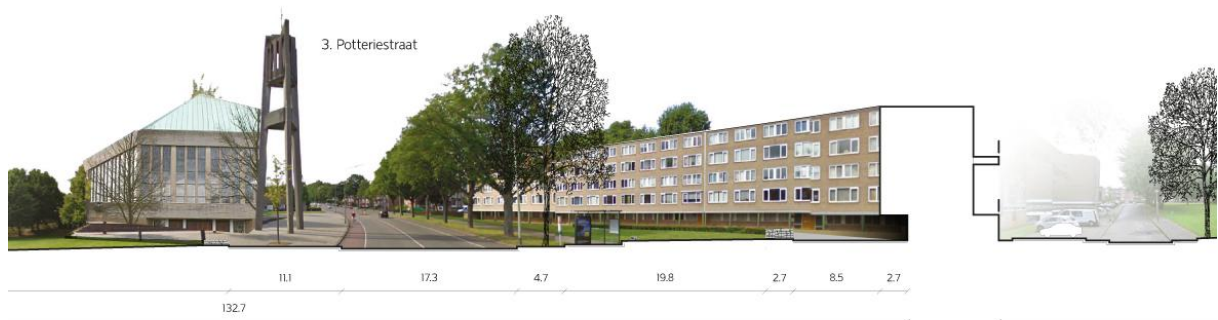
Huidig profiel Potteriestraat, Pottenberg

terug te bouwen. 2) De gekromde gevel volgt dezelfde contour en deze gevel moet een "collectieve" uistraling hebben. 3) De adressen van dit gebouw bevinden zich aan de Roemerstraat. Hierdoor kent het gebouw twee voorkanten. Bij een gedragen plan dat voldoet aan bovenstaande randvoorwaarden is de gemeente Maastricht in principe bereid om ontheffing te verlenen van het bestemmingsplan en een sloopvergunning te verlenen. De herontwikkeling staat gepland voor 2017/2018.