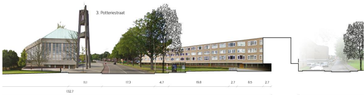
Toekomstig profiel Potteriestraat, Pottenberg